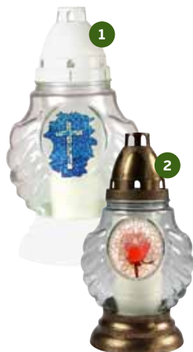
VITRÁŽ BIG / VITRÁŽ RŮŽE