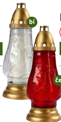
KVĚT RŮŽE MEDIUM