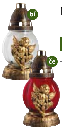
MELOUNEK ANDĚL DEKOR

LAMPY SKLENĚNÉ S PLASTICKÝM DEKOROM / LAMPY SZKLANE Z PLASTIKOWYM DEKOREM / GLASS LAMPS WITH PLASTIC DECOR