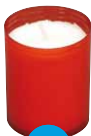
Lampička bez víčka 3x4 ks Lampička bez viečka 3x4 ks