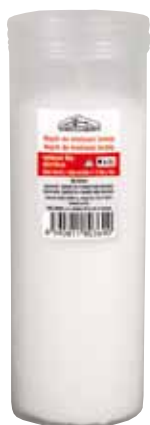
Náplň vosková Náplň vosková