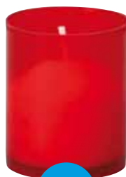
Lampička bez víčka 5 ks Lampička bez viečka 5 ks