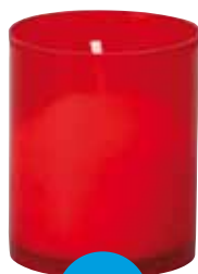
Lampička bez víčka 4 ks Lampička bez viečka 4 ks