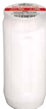
Náplň olejová Náplň olejová