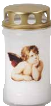
Lampička ANDĚL s kovovým víčkem Lampička ANDĚL s kovovým viečkom