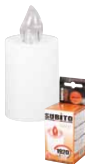
AURUS / HARMONY