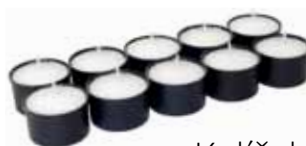
Kalíšek hřbitovní 10 ks Kahanec hřbový 10 ks