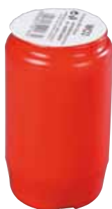
Náplň olejová MEMORIA Náplň olejová MEMORIA