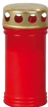
Lampička s kovovým víčkem Lampička s kovovým viečkom