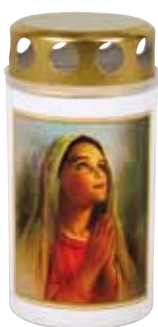
Lampička MADONA s kovovým víčkem Lampička MADONA s kovovým viečkom