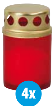
Lampička s kovovým víčkem 4 ks Lampička s kovovým viečkom 4 ks